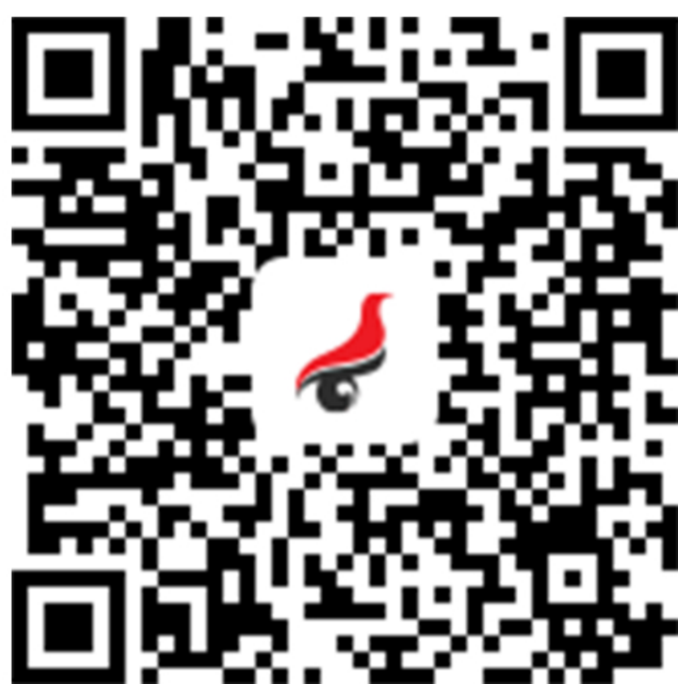
学信网 APP 官方下载

如果您没有学信网账号，或者您不清楚自己是否有学信网账号，扫描下方二维码下载学信网 APP 进行注册、登录，并进行人脸识别验证。